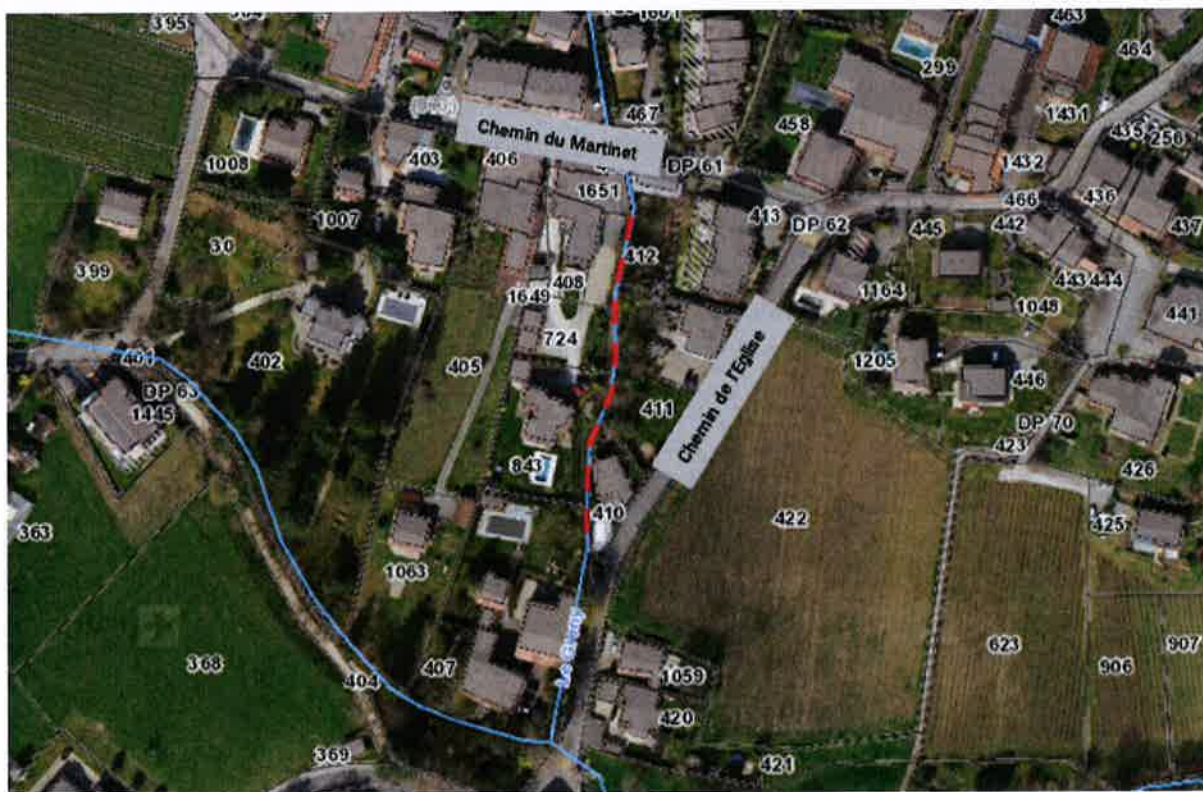
Figure 1 – Tronçon du canal « Le Greny » concerné par l'étude (traitillé rouge)

Le tronçon du canal du « Greny » concerné par les travaux est situé sur les parcelles privées n° 408, 724, 411, 412, 410 et 843 à Commugny (voir figure 1). Ce tronçon est principalement situé en zone de verdure et la berge en rive gauche est partiellement située en zone forestière, au niveau de la parcelle n° 411.