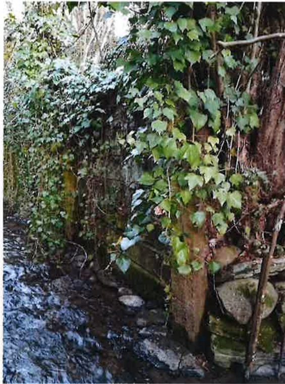
Photo 1 – Mur de planches en bois situé en rive gauche, sur la parcelle n° 412

En sortie du passage sous le Chemin du Martinet, le cours d'eau présente un mur de soutènement en rive gauche. Celui-ci est affouillé sous la partie constituée de planches en bois (parcelle n° 412). De plus, les planches sont en très mauvais état.